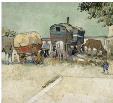
Les roulottes, campement de bohémiens aux environs d'Arles Vincent van Gogh

Mais pas question de traîner, le programme étant chargé : direction la Fondation Van Gogh ; là, guidés dans notre visite nous avons admiré quelques tableaux de l'illustre peintre, momentanément arlésien, et les œuvres peu conventionnelles d'Alice Neel , mais l'art fait souvent débat et c'est une bonne chose !